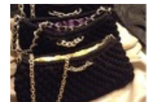
Baguette Ersa Lavorata a mano