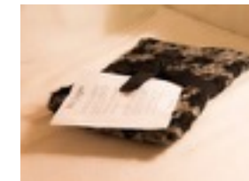
Busta a mano Mini Scigno Lavorata a mano