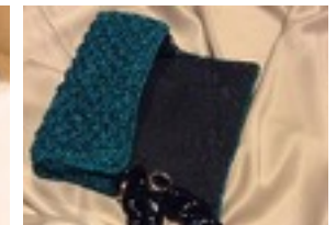
Elegance Lavorata a mano