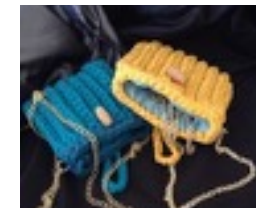
Ebe Lavorata a mano

Per questo motivo negli anni è stato studiato e messo a punto un metodo per riequilibrare energeticamente gli habitat senza modificarne la struttura fisica. Tale riequilibrio avviene grazie a veicolanti energetici. Una volta verificata la validità, si è applicata la stessa dinamica di riequilibrio ai capi di abbigliamento.